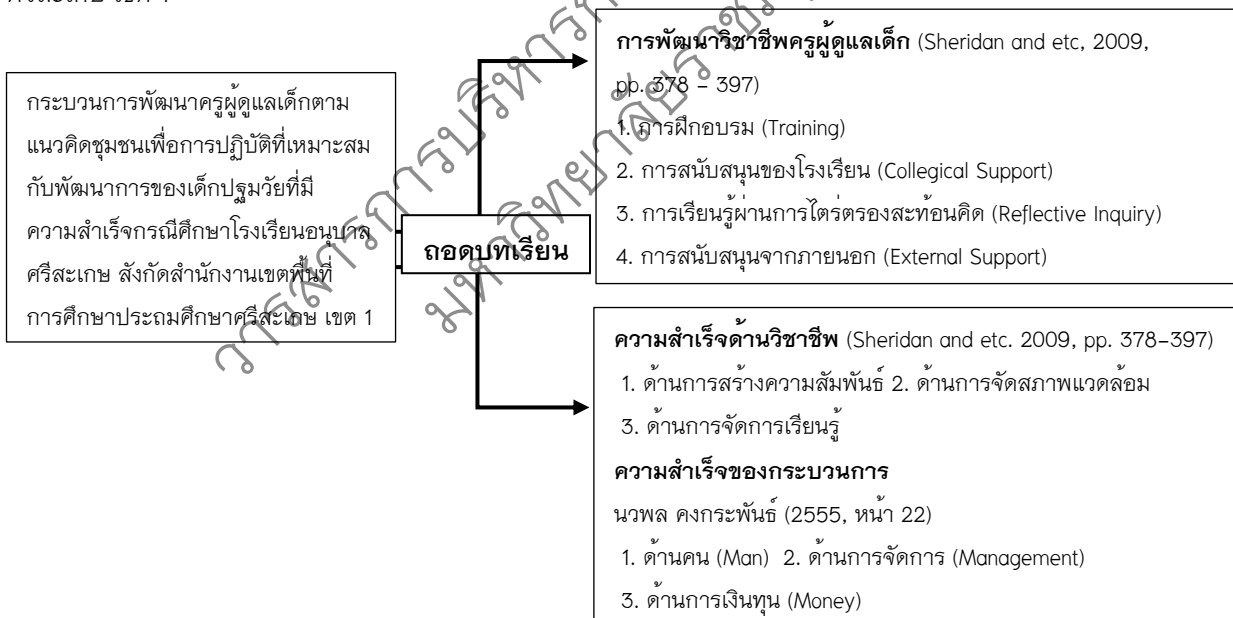
ภาพประกอบ 1 กรอบแนวคิดการวิจัย

กรอบแนวคิดในการวิจัย การพัฒนาครูผู้ดูแลเด็กตามแนวคิดชุมชนเพื่อการปฏิบัติที่เหมาะสมกับพัฒนาการของเด็กปฐมวัยที่มีความสำเร็จกรณีศึกษาโรงเรียนอนุบาลศรีสะเกษ สังกัดสำนักงานเขตพื้นที่การศึกษาประถมศึกษาศรีสะเกษ เขต 1