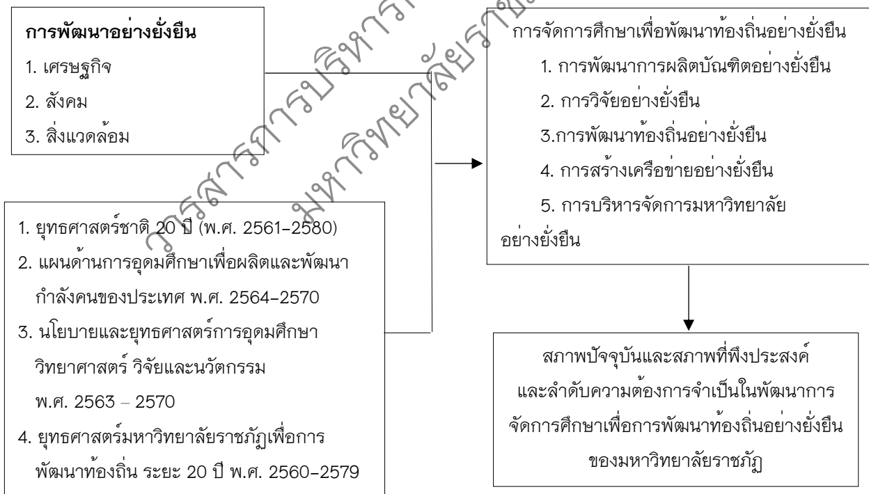
ภาพประกอบ 1 กรอบแนวคิดการวิจัย