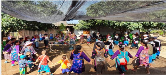
ภาพประกอบ 4 ลักษณะทั่วไปของหมู่บ้านลิซู (ลีซอ) บ้านห้วยน้ำริน ตำบลปึงโค้ง อำเภอเชียงดาว จังหวัดเชียงใหม่