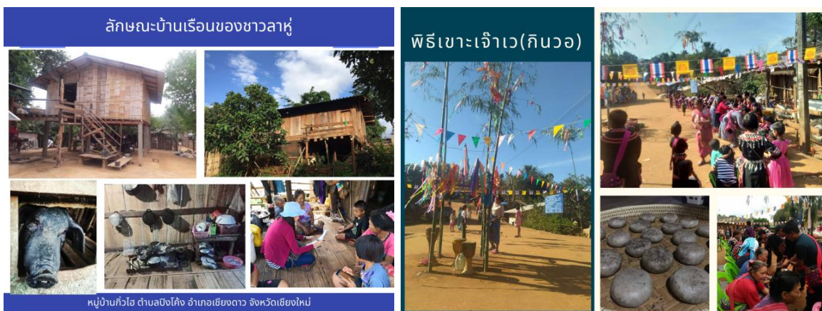
ภาพประกอบ 2-3 ลักษณะทั่วไปของหมู่บ้านลาหู่ (มุเซอ) บ้านกัวไฮ ตำบลบึงโค้ง อำเภอเชียงดาว จังหวัดเชียงใหม่

3. การจัดทำคู่มือการบริหารจัดการแหล่งเรียนรู้วิถีชีวิตของกลุ่มชาติพันธุ์บนพื้นที่สูงในโรงเรียนบ้านปางมะเยา อำเภอเชียงดาว จังหวัดเชียงใหม่โดยใช้กระบวนการวงจรคุณภาพ PDCA ของเดมมิง (Deming) ซึ่งประกอบด้วย 4 ขั้นตอน คือ 1) การวางแผน (Plan-P) การวางแผนการจัดการจัดทำคู่มือการบริหารจัดการแหล่งเรียนรู้ 2) การปฏิบัติ (Do-D) การจัดทำคู่มือการบริหารจัดการแหล่งเรียนรู้ 3) การตรวจสอบ (Check-C) การตรวจสอบคู่มือการบริหารจัดการแหล่งเรียนรู้ 4) การปรับปรุง (Act-A) การปรับปรุงคู่มือการบริหารจัดการแหล่งเรียนรู้ โดยคู่มือการบริหารจัดการแหล่งเรียนรู้วิถีชีวิตของกลุ่มชาติพันธุ์บนพื้นที่สูงในโรงเรียนบ้านปางมะเยา ประกอบด้วย ข้อมูลทั่วไปของโรงเรียนบ้านปางมะเยา วัตถุประสงค์ของการจัดทำคู่มือการบริหารจัดการแหล่งเรียนรู้ โครงสร้างและหน้าที่รับผิดชอบของการบริหารจัดการแหล่งเรียนรู้ วิถีชีวิตของกลุ่มชาติพันธุ์ลาหู่ วิถีชีวิตของกลุ่มชาติพันธุ์ลีซอ วิถีชีวิตของกลุ่มชาติพันธุ์ม้ง วิถีชีวิตของกลุ่มชาติพันธุ์อาข่า วิถีชีวิตของกลุ่มคนพื้นเมือง และการบูรณาการแหล่งเรียนรู้สู่การจัดการเรียนการสอน และได้ตรวจสอบคู่มือพบว่าคู่มือการบริหารจัดการแหล่งเรียนรู้วิถีชีวิตของกลุ่มชาติพันธุ์บนพื้นที่สูงในโรงเรียนบ้านปางมะเยา อำเภอเชียงดาว จังหวัดเชียงใหม่ สามารถใช้เป็นแนวทางในการขับเคลื่อนแหล่งเรียนรู้วิถีชีวิตของกลุ่มชาติพันธุ์บนพื้นที่สูง ให้เป็นศูนย์กลางในการเรียนรู้สร้างความเข้มแข็งแก่ชาติพันธุ์ของนักเรียนในโรงเรียนบ้านปางมะเยา อำเภอเชียงดาว จังหวัดเชียงใหม่ อย่างยั่งยืน