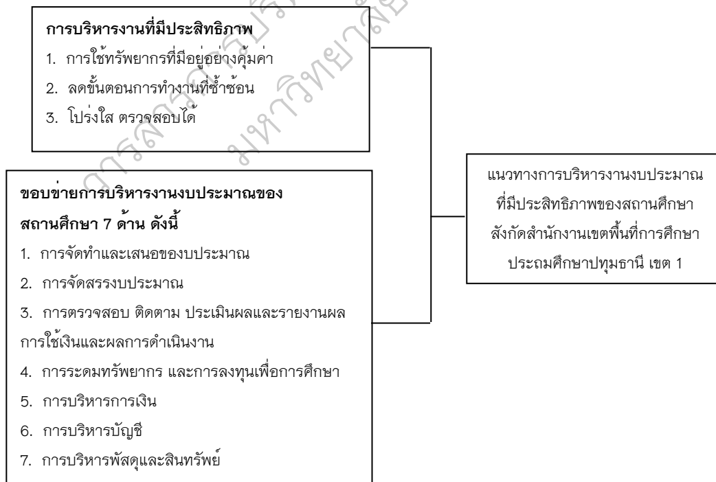
ภาพประกอบ 1 กรอบแนวคิดในการวิจัย