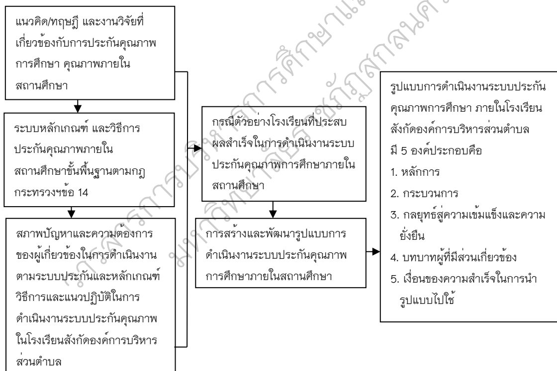
ภาพประกอบ 1 กรอบแนวคิดการวิจัย

จากการสังเคราะห์แนวคิดเกี่ยวกับการพัฒนารูปแบบการดำเนินงานระบบการประกันคุณภาพการศึกษาในโรงเรียนสังกัดองค์การบริหารส่วนตำบลกำหนดเป็นกรอบแนวคิดการวิจัยดังภาพประกอบ ดังนี้