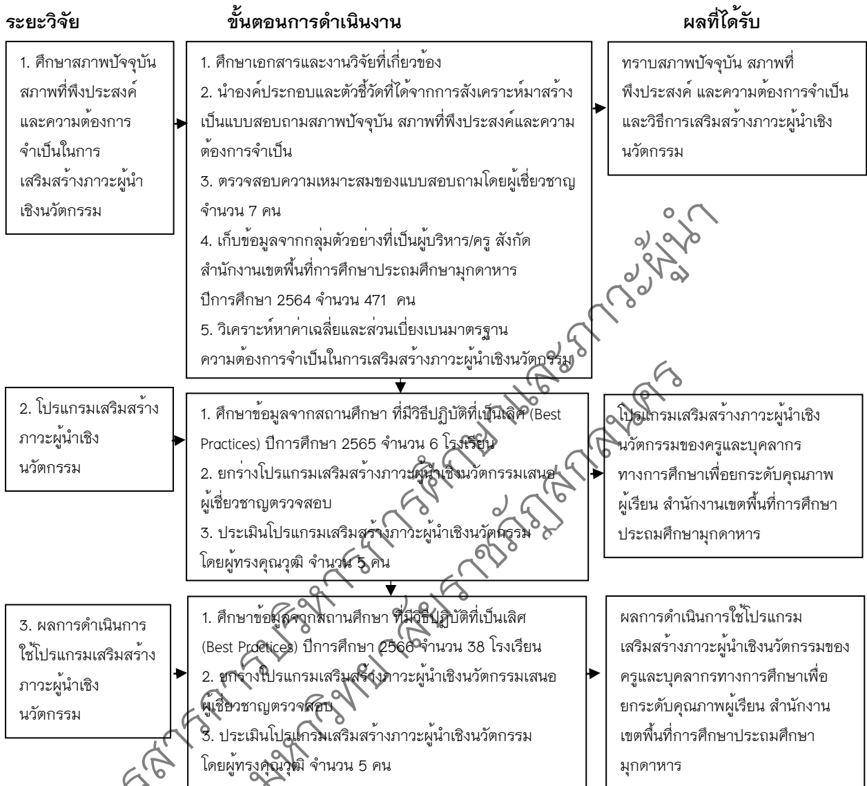
ภาพประกอบ 2 แสดงระยะการวิจัย ขั้นตอนดำเนินการ และผลที่ได้รับ

ระยะที่ 3 ศึกษาผลการใช้โปรแกรมเสริมสร้างภาวะผู้นำเชิงนวัตกรรมของครูและบุคลากรทางการศึกษา เพื่อยกระดับคุณภาพผู้เรียน สำนักงานเขตพื้นที่การศึกษาประถมศึกษามุกดาหาร