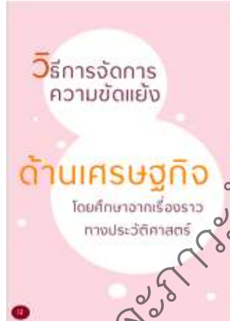
ภาพประกอบ 2 ตัวอย่างหน้าปกหนังสือเล่มเล็ก และส่วนนำเข้าสู่เนื้อหาวิธีการจัดการความขัดแย้งด้านเศรษฐกิจ

4. การประเมินหนังสือเล่มเล็กดำเนินการเพื่อให้ทราบถึงระดับความพึงพอใจของกลุ่มตัวอย่างที่เป็นนักเรียนระดับมัธยมศึกษา สำหรับรายการการประเมินหนังสือนั้น ประกอบไปด้วย หลักการความสำคัญของประเด็นความขัดแย้ง การยกตัวอย่างและวิธีการจัดการความขัดแย้ง ตัวอย่างการปรับตัวของนักเรียน ลีลา ภาษา และการจัดรูปเล่ม ประโยชน์ของหนังสือและการนำไปใช้ เป็นต้น โดยมีผลการประเมินตามตาราง 2 ดังนี้