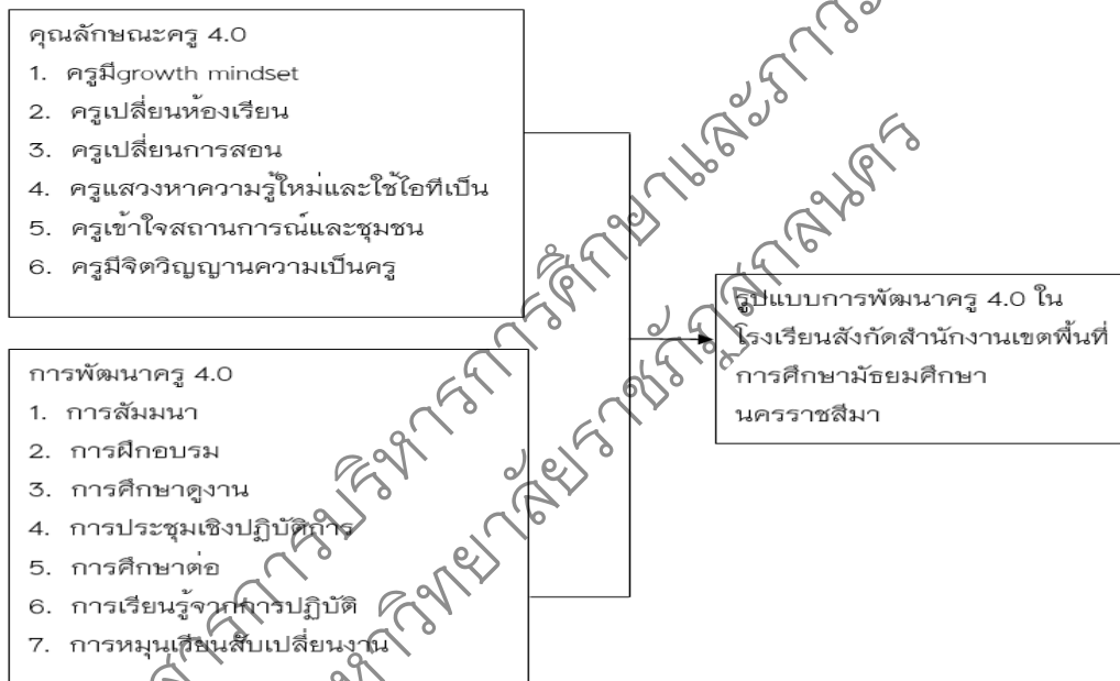
ภาพประกอบ 1 กรอบแนวคิดการวิจัย