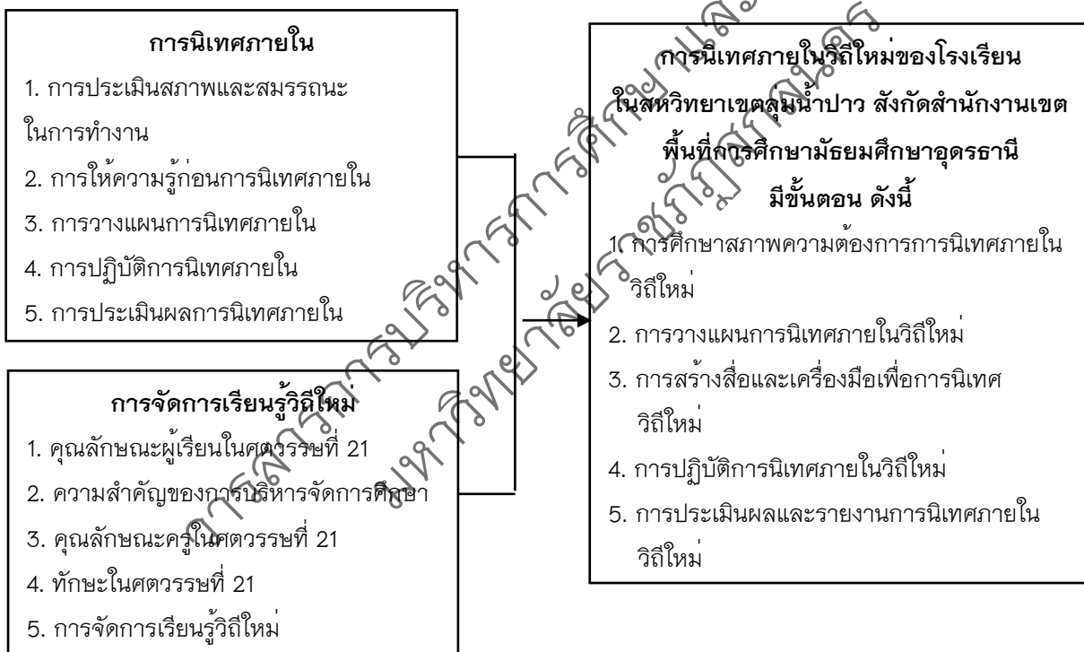
ภาพประกอบ 1 กรอบแนวคิดการวิจัย